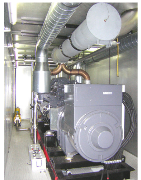
Impianto di cogenerazione alimentato ad olio vegetale, 540 kW el